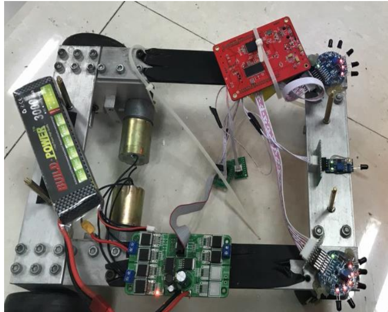
灭火小车内部结构